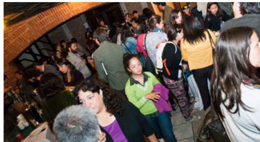
Ceremonia entrega de Fondos Concursables 2013

Apoyo para el desarrollo artístico, difusión cultural y conservación patrimonial por medio de programas y concursos de proyectos literarios y editoriales.