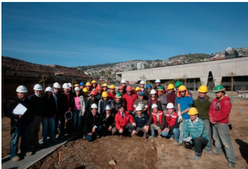
Trabajos de ornamentación Parque Cultural 2012

Así, para el año 2011 se inauguraron en la región dos centros culturales: uno en Los Andes y otro en Villa Alemana, con una inversión de más de 1.690 millones de pesos. En tanto que en el 2013 abrió el de San Antonio y se encuentran en ejecución los centros culturales de Quillota, Quilpué y La Calera. Además, se sumó un nuevo centro para las artes en Isla de Pascua y el Parque Cultural Valparaíso.