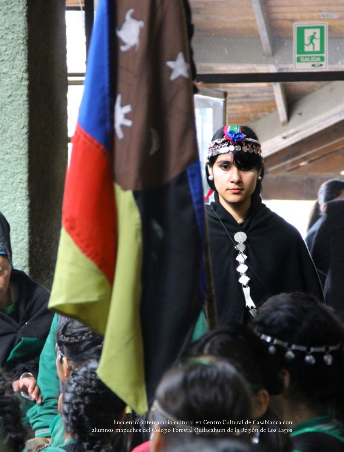
Encuentro intercambio cultural en Centro Cultural de Casablanca con alumnos mapuches del Colegio Forestal Quilacahuin de la Región de Los Lagos