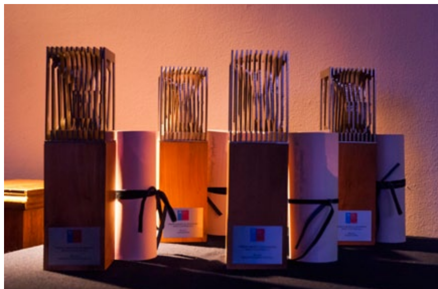
Arriba: II Seminario Cultura e Industrias Creativas Innovación y Territorio 2013. Abajo: Primera Versión Premios de Arte y Cultura Región de Valparaíso.