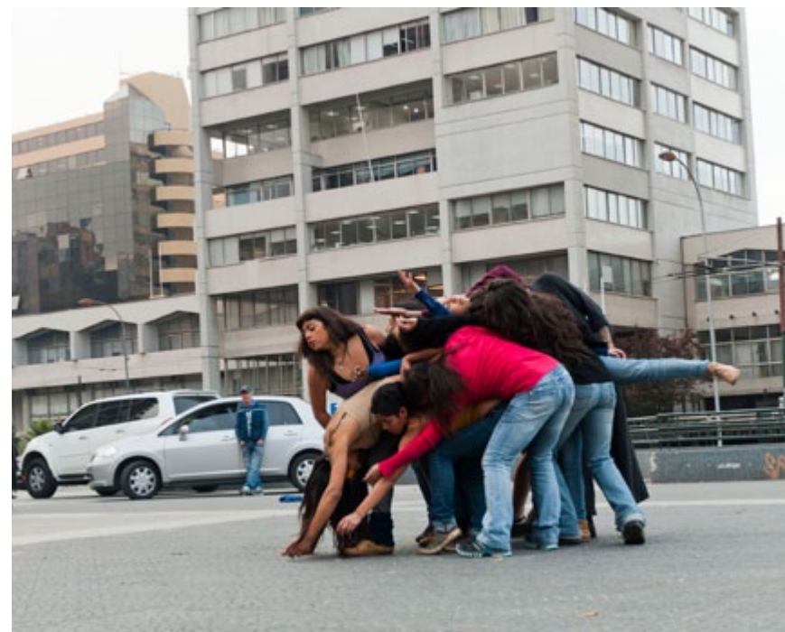
Intervención espacio público Día de la Danza 2013

Por último, durante 2013 las comunas beneficiadas fueron Puchuncaví, Nogales, Santa María y Petorca, en las cuales se realizaron comitivas culturales, instancias a cargo de colectivos artísticos, quienes en estadios de diez días, trabajaron con las comunidades técnicas de teatro, valoración del patrimonio local y la gastronomía como expresión de cultura.